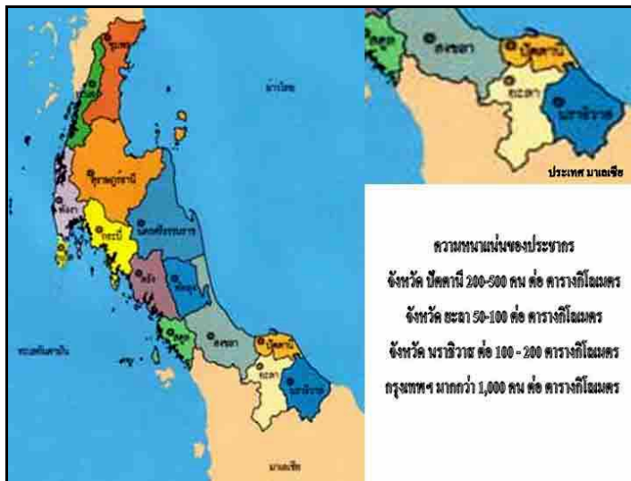
ภาพที่ 9.1 แผนที่ภาคใต้ จังหวัดปัตตานี จังหวัดยะลา และจังหวัดนราธิวาส

ปัญหาความไม่สงบใน 3 จังหวัดชายแดนภาคใต้ เป็นที่ทราบกันดีว่ามีมานานแล้ว แต่ในปัจจุบันข่าวสถานการณ์ของ 3 จังหวัดดังกล่าว ได้ถูกนำเสนอออกมาในลักษณะของความรุนแรง การทำร้าย การสู้รบต่างๆ อย่างต่อเนื่อง ดังนั้น ต่อให้เป็นคนที่อยู่ไกลหรือไม่สนใจข่าวอย่างไร ก็ย่อมกระทบต่อความรู้สึกและสร้างความไม่สบายใจต่อประชาชนทั้งประเทศอย่างหลีกเลี่ยงไม่ได้