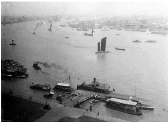
ภาพ 9.4 Shanghai ประเทศจีน ภาพถ่าย พ.ศ.2473

คลองไทยจะทำให้ยุทธศาสตร์ทางด้านพลังงาน และการเคลื่อนย้ายกำลังทางทหารได้อย่างอิสระทั้งสองฝั่งทะเลของไทยให้ได้เปรียบ ในเรื่องการขนส่งระยะเวลาค่าใช้จ่ายในการขนส่งทางทะเล ซึ่งในปัจจุบันเรือขนส่งน้ำมัน หรือเรือขนส่งสินค้าทุกลำที่นำมาส่งยัง จังหวัดชลบุรี จังหวัดระยอง หรือแม้แต่กรุงเทพฯ จะต้องผ่านน่านน้ำสากลของต่างประเทศ ทั้งด้านฝั่งทะเลอันดามัน และทะเลฝั่งอ่าวไทย เช่น ประเทศมาเลเซีย ประเทศอินโดนีเซีย ประเทศสิงคโปร์ ประเทศเวียดนาม และประเทศเขมร หากเกิดวิกฤติที่คาดไม่ถึงประเทศไทยจะเสียเปรียบมาก และอันตรายต่อความมั่นคงของประเทศเป็นอย่างมาก