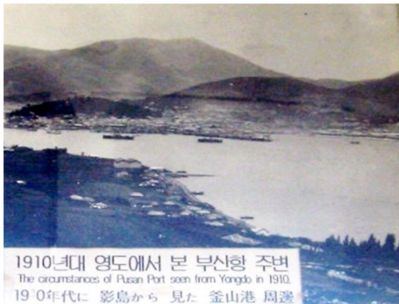
ภาพที่ 9.2 ท่าเรือปูซาน เกาหลีใต้ ถ่าย พ.ศ. 2453

ทั่วโลกด้วย ต่างก็สนใจที่จะเข้ามาลงทุน ทำธุรกิจในพื้นที่ดังกล่าวด้วย ดังนั้น พื้นที่ในบริเวณดังกล่าว จะกลายเป็นสังคมเมืองใหม่ที่มีความเจริญมากมาย ผู้คนทั่วประเทศ จะหลั่งไหลเข้ามาเหมือนเมืองท่าต่างๆ ที่เจริญทั่วโลก ที่อยู่บนเส้นทางผ่านของการเดินเรือทะเลนานาชาติของทุกประเทศทั่วโลก เช่น เมืองท่าปูซานของเกาหลีใต้ ที่มีรายได้มากมายมหาศาลจาก ธุรกิจต่างๆ บริเวณรอบเมืองท่าเรือทางทะเลของเกาหลี ดังจะเห็นได้ จากรายได้ผลผลิตมวลรวมประชาชาติ (GDP) เฉพาะที่เมืองปูซานแห่งเดียวของประเทศเกาหลีใต้มีรายได้ถึง 7,000,000 ล้านบาทต่อปี มากกว่ารายได้ผลผลิตมวลรวมของประเทศไทยทั้งประเทศในปัจจุบัน โดยที่มีประชากรเพียง 4 ล้าน 5 แสนคนเท่านั้น หรือเมืองท่าที่ฮ่องกงของประเทศจีน หรือประเทศสิงคโปร์ เป็นต้น นอกจากนี้ การที่คลองไทยทำให้เกิดเมืองใหญ่ ยังจะเป็นเสมือนการสร้างกองทัพประชาชนให้เข้าไปช่วยกันปกป้องผืนแผ่นดินไทยใน 3 จังหวัดชายแดนภาคใต้ได้อย่างแท้จริงทางหนึ่ง นอกจากนี้จะเป็นการนำความเจริญเข้าไปในพื้นที่ภาคใต้ได้อย่างปลอดภัย และยั่งยืนโดยที่ไม่มีพลังอำนาจหรืออิทธิพลใดๆ สามารถต้านทานได้