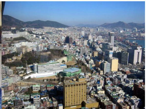
ภาพที่ 9.3 ท่าเรือปูซาน เกาหลีใต้ ถ่าย พ.ศ. 2546

ภาพ 9.2 และ ภาพ 9.3 ท่าเรือเมืองปูซาน ประเทศเกาหลีใต้ จากทั้งสองภาพเป็นการอธิบายได้เป็นอย่างดีว่า คลองเกิดที่ไหนความเจริญไปที่นั่น เมืองปูซานเคยเป็นที่จัดการแข่งขันกีฬาโอลิมปิก